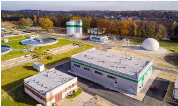
Dzień otwarty organizuje oczyszczalnia ścieków w Skoczowie.

Ciekawe atrakcje czekają również na dzieci i ich rodziców 11 maja w gmachu dawnego Dworca PKP w Rudzie Śląskiej, który zrewitalizowano dzięki Funduszom Europejskim. Stworzono tam nowoczesną bibliotekę. Poza możliwością zwiedzania całego imponującego obiektu, organizatorzy zaplanowali czytanie bajek z krajów Unii Europejskiej, konkurs plastyczny „Rozsypywanka unijna” oraz gry planszowe. Rodziców z pewnością zainteresuje wystawa zdjęć dokumentująca proces przebudowy dworca.