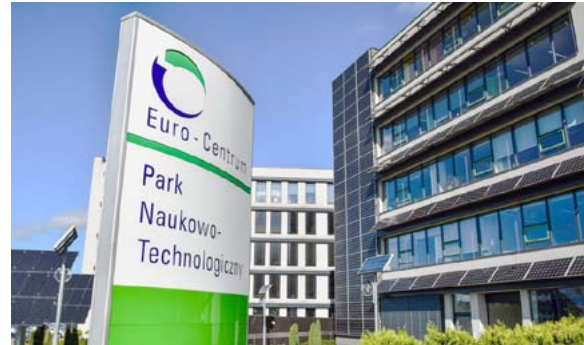
W Euro-Centrum będzie można zobaczyć... sztuczne słońce.

FabLab z Bielska-Białej organizuje 10 maja Open Makers Day. Tylko tutaj każdy nasz pomysł będzie mógł nabrać rzeczywistych wymiarów i przekształcić się w gotowy produkt. Uczestnicy sprawdzą w działaniu nowoczesne drukarki 3D, zapoznają się z funkcjonowaniem wycinarki laserowej czy plotera. Przygotowano także konkurs z na-