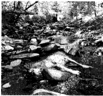
• Martwy wilk odnaleziony w beskidzkim potoku